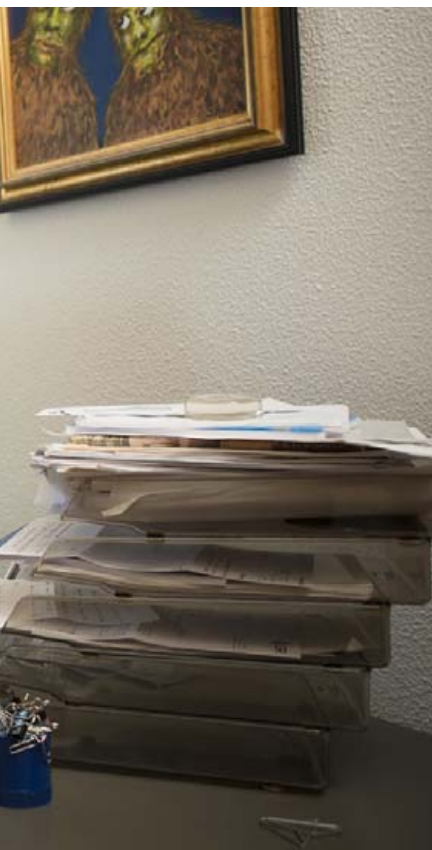
gögn sem hann sækir í.

greiðslunni 2010 á meðan minn málstaður fékk 98%," segir Hannes. „Þannig að ég myndi nú ekki segja að ég sé neinn jaðarmaður í stjórn-málum eða þjóðfélagsmálum en ég er óneitanlega jaðarmaður í Háskólanum.